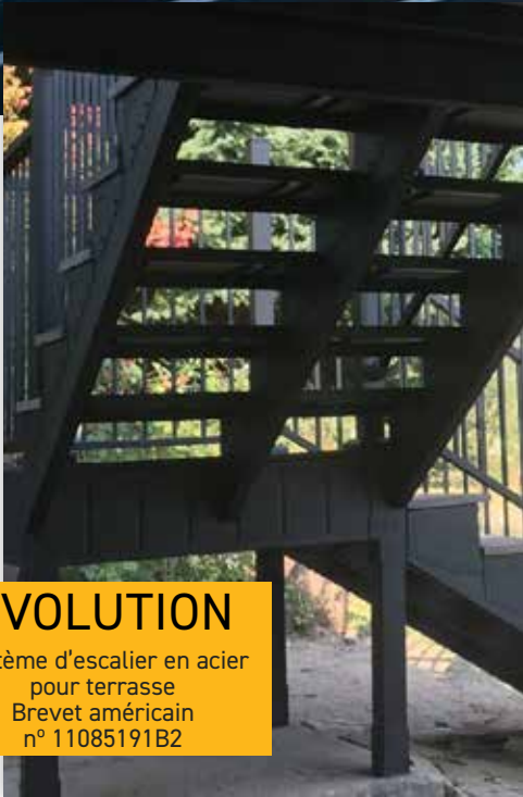
EVOLUTION Système d'escalier en acier pour terrasse Brevet américain n° 11085191B2